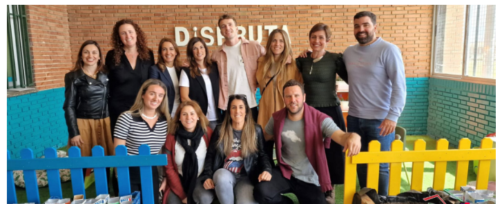
VISITA A TRILEMA. San Felix, Patronato S. Eulalia y San Fidel.